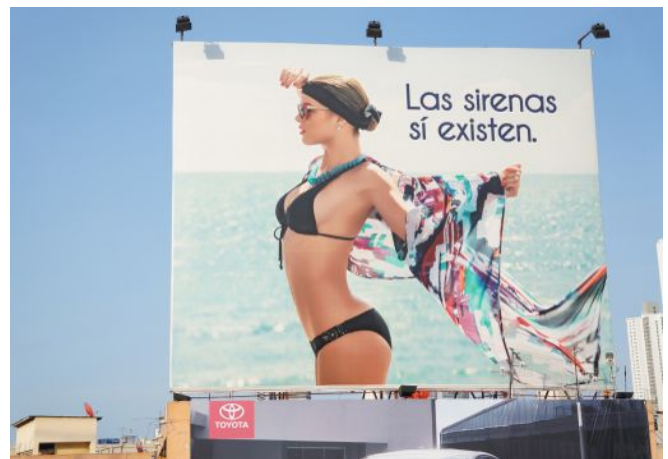
Campaña publicitaria de almacén conocido en Panamá, Panamá- verano 2014